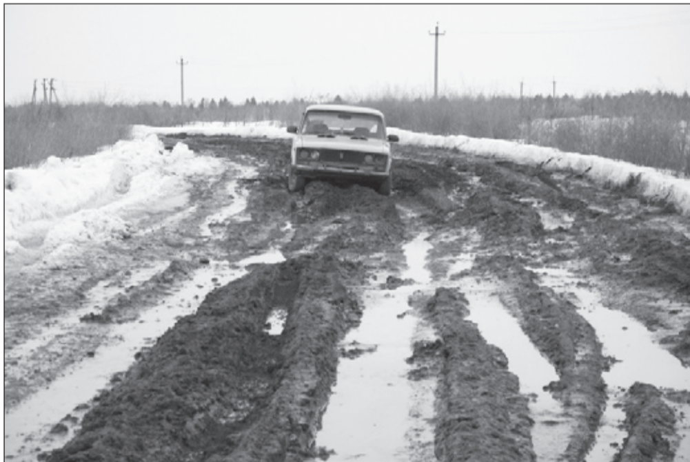
Данная автодорога, является единственным подъездом для пяти населенных пунктов. Она не видела ремонта 20 лет. Бывшее Гончаровское, сейчас Майское сельское поселение.

Золотые слова... и все зрят в корень. Но, что нам слова? Мы и так знаем эти проблемы не понаслышке. Мы видим их каждый день, пытаюсь добраться до работы, до дачи, до соседнего города. Мы каждый год видим все более плачевное состояние наших автомобильных дорог. Многие из них уже потеряны. Многие не соответствуют никаким нормативам. Другие же ждут ремонта десятилетиями. Средств, выделяемых на ремонт, катастрофически не хватает.